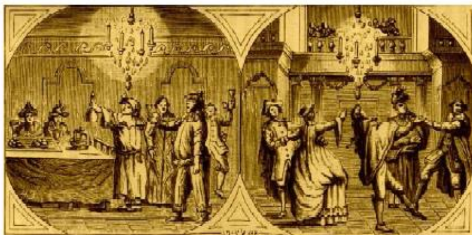
13. Пригласительный билет на бал.

Войнович Марко Иванович (1750-1807) . Вице-адмирал (1801) . Уроженец Черногории. В 1780 г.—командир Астраханской (Каспийской) флотилии. С 1783 г. служил на Черном море. В 1789 г. контр-адмирал Войнович командует Черноморским флотом, а в 1800 г.—Каспийской флотилией. В 1791 г. уходит в отставку и уезжает на родину. С 1797 г. вновь на русской службе.