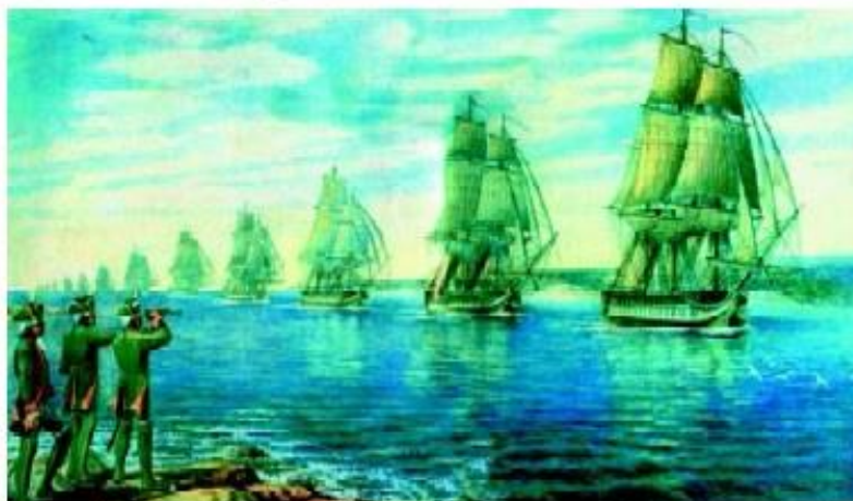
2. Вход эскадры Клокачева в Ахтиарскую бухту.

ря 1782 года. Прожив здесь зиму, моряки чувствовали себя старожилами. Они построили казармы недалеко от татарской деревушки Ахтиар, что была брошена жителями. Соорудили баню. Сами стирали, штопали одежду. Для пополнения запасов продовольствия ловили рыбу, стреляли диких коз. Но, главное, было изучено место для нового города и гавани. Команды провели подробнейшие промеры бухт и их съемку. Оказалось, что корабли здесь и от ветров надежно защищены, и грунт дна не портит якорей.