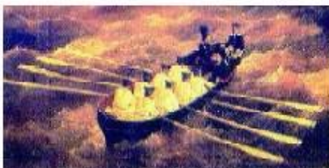
9. Шлюпка с гребцами. Начало XIX в.

Сарандинакина балка называлась по имени офицера Евстафия Сарандинаки, грека по происхождению. Он владел здесь хутором.