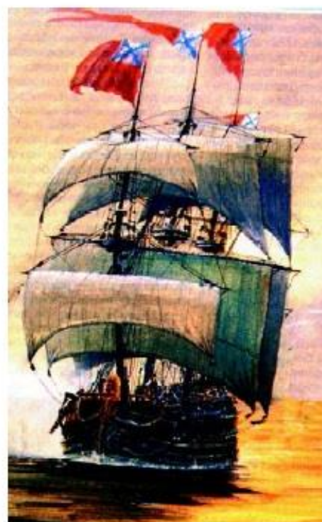
3. Фрегат. XVIII в.

Назовите еще одно важное событие, произошедшее в 1783 г.