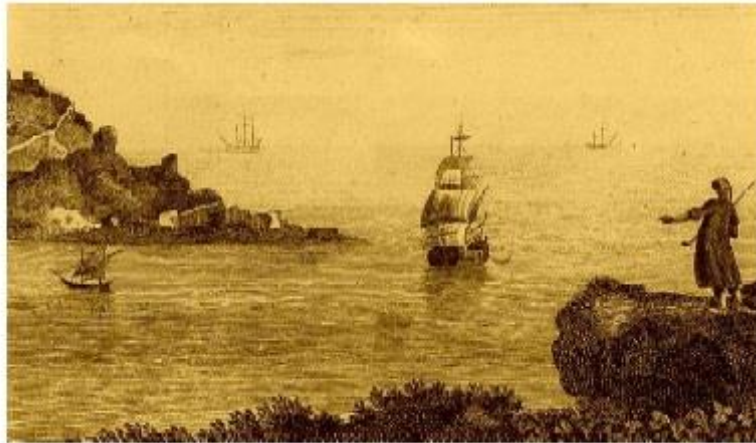
6. У стен древнего Херсонеса. С рисунка конца XVIII в.

тельных материалов: леса, кирпича, цемента. Кое-что добывали на месте. Камень, например, велено было брать из руин Херсонеса. Правда, очень скоро мастеровые убедились, что гораздо проще рубить его в Инкермане. Лес искали в окрестных горах, пытаясь организовать доставку с помощью татар. Но все это не решало проблему.