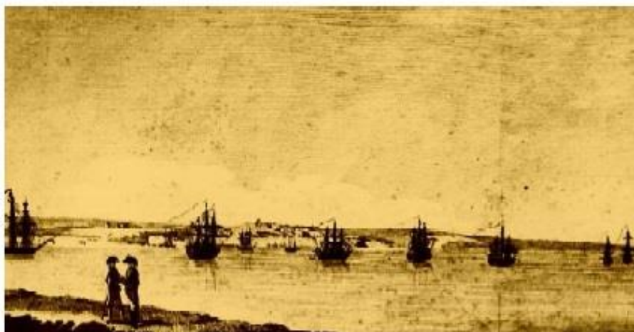
8. Севастополь в конце XVIII в.