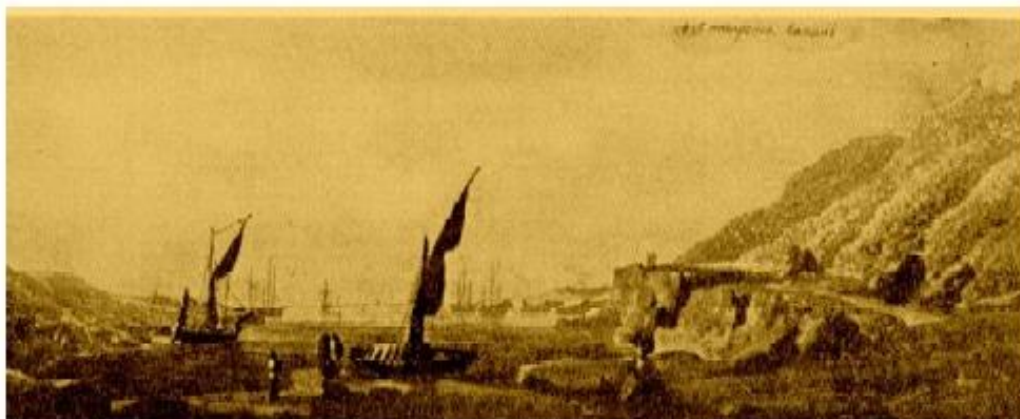
11. Вид Ахтиарской бухты в 80-х годах XVIII в.