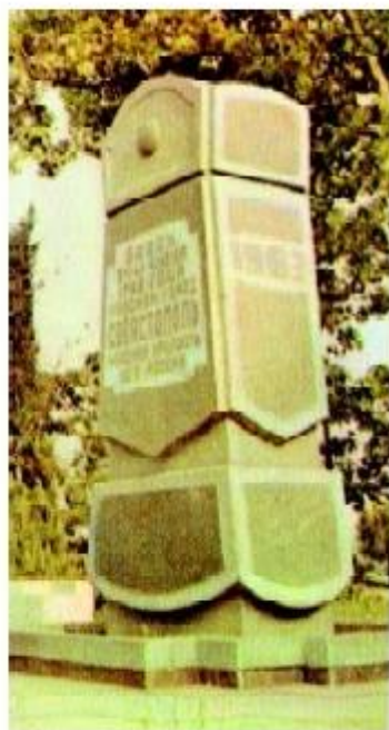
5. Памятный знак в честь основания города Севастополя.

Макензи Фома Фомич (1748-1785). В ночь с 25 на 26 мая 1770 г. командовал одним из брандеров (судно, наполненное горючим или взрывчатым веществом), уничтоживших турецкий флот в Чесменской бухте. В 1783 г. произведен в контр-адмиралы и назначен на Черноморский флот. Первый командир Севастопольского порта.