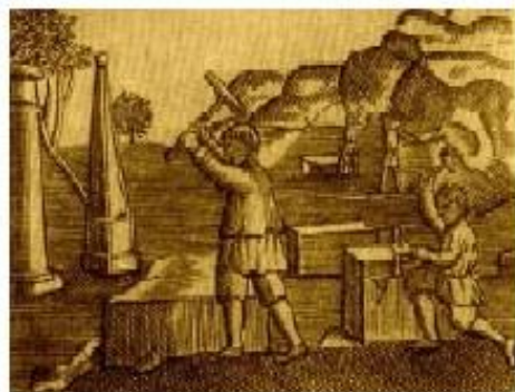
10. Каменотесы. Гравюра XVIII в.