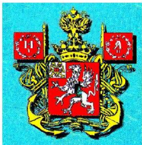
1. Герб Севастополя. Утвержден в 1893 г.

Клокачев Федот Алексеевич (1732-1783) . Вице-адмирал (1782) . Отличился в Чесменском сражении, командуя линейным кораблем "Европа". С 1776 г.—командующий Азовской флотилией. 11 января 1783 г. назначен командовать флотом, "заводимым на Черном и Азовском морях". Скончался в Херсоне осенью того же года во время эпидемии чумы.