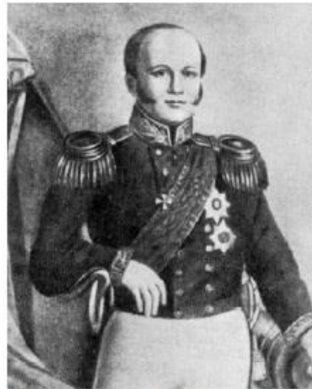
7. Сенявин Дмитрий Николаевич (1763-1831) . Выдающийся флотоводец, адмирал (1826). В 1782 году переведен с Балтийского на Азовский, а затем на Черноморский флот. В 1804-1807 гг. командовал сухопутными и морскими силами России в Средиземном море.

Можно ли было так решить проблему обеспечения строительным камнем?