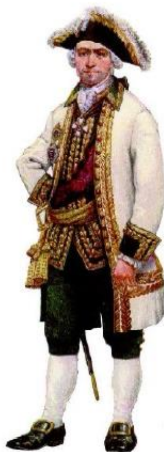
12. Адмирал эпохи Екатерины II.

Первая улица Севастополя называлась Балаклавской. Какое название она носила позже? Как называется сейчас?